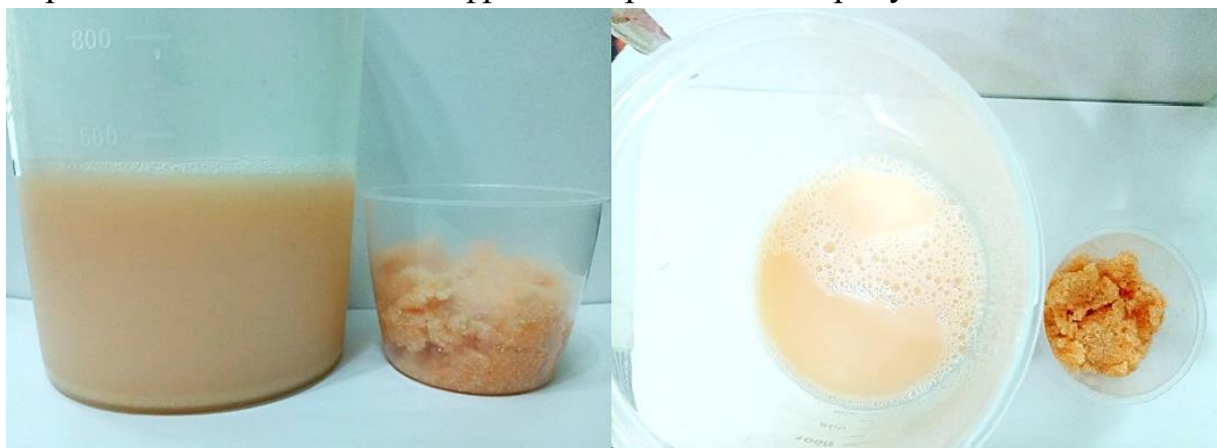
Рисунок 3 – Проба приготовленного экстракта

Принцип работы измельчающе-экстракционного устройства: семена сои предварительно замачивались в воде в течении 8 часов. Морковь подвергалась измельчению до размера семян сои. После чего оба компонента смешивались с водой, объемная доля которой оставалась неизменной. Исследованиями установлено, что оптимальным значением соотношения семян сои, корнеплодов и воды являлось соотношение 1:8. Данное соотношение также применимо для создания соево-свекольной и соево-тыквенной композиции. При помощи подающе-распределяющего узла (ПРУ) композиция подавалась на рабочую поверхность между дисками. При взаимодействии соево-морковной композиции с упругими металлическими элементами верхнего и нижнего диска, происходило растирание. Сменные диски устанавливались на патрубке верхнего рабочего органа и роторе нижнего рабочего органа установки. Полученный белково-витаминный экстракт проходил через фильтрующий элемент, установленную на коническом диске. Впоследствии происходило отделение нерастворимого остатка (жома) от жидкой фракции. Проба полученного нерастворимого остатка и жидкой фракции приведены на рисунке 3.